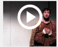
Padre Pio va in scena nel musical 'Actor Dei'